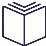
MANUEL OPÉRAIRE/ LIVRETS DE PRISE DE NOTE