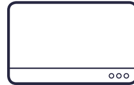
GRAND ÉCRAN DE PROJECTION/ RÉTRO PROJECTION