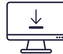
LOGICIEL « OGA » (OUTILS DE GESTION DES AFFAIRES)