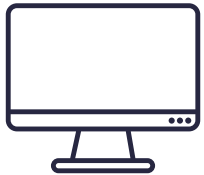
ORDINATEURS ET LOGICIELS