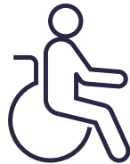
2 SALLES DE CLASSES ACCESSIBLES PMR